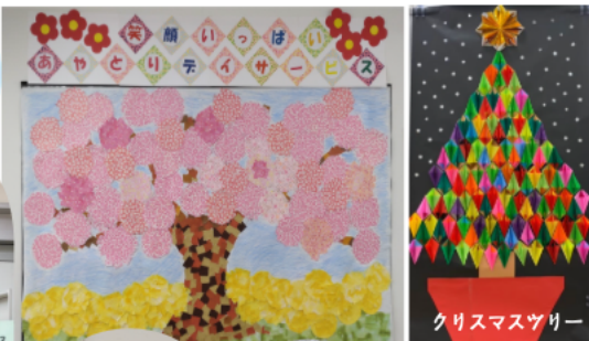
クリスマスツリー

コロナ禍で外出が難しいためデイでは、作品制作に取り組みました。利用者さんの作品です。