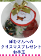
ぼむさんへの クリスマスプレゼント お手玉