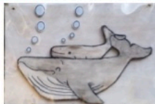
↑親子のくじらが、目印に